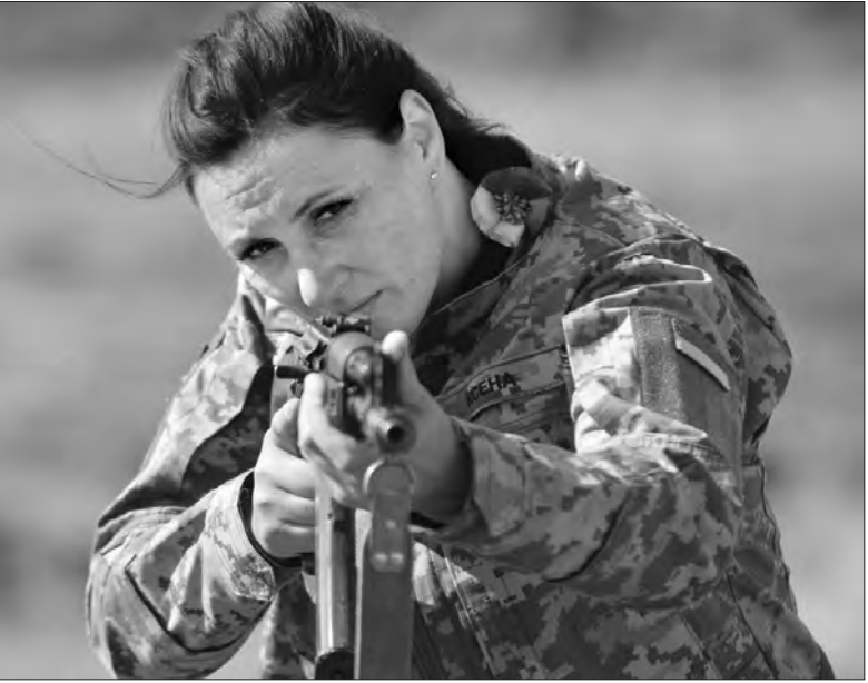
Бійчиня тренується у стрільбі на базі батальйону «Легіон-Д» у Києві. Сьогодні країну захищають понад 60 тисяч жінок. Більш як 42 тисячі — у лавах Збройних Сил.

Ірина БУЛАНЕНКО.